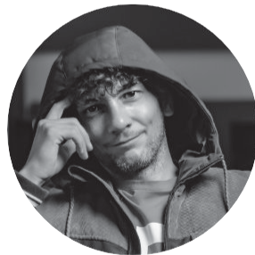
Adrien Pélissié Réalisateur Monteur Effets spéciaux